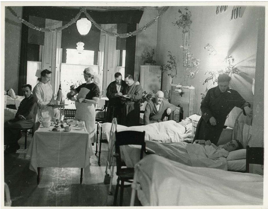
Jul på norsk sjukehus i London. PA-1209 NTBs krigsarkiv Ub-48

Krig fører med seg meir sjukdom. Det var særleg oppblomstring av tuberkulose og kjønssjukdomar som ga helsestyresmaktene utfordringar. Behovet for helsetenester og behandlinginstitusjonar for nordmenn i eksil var stort.